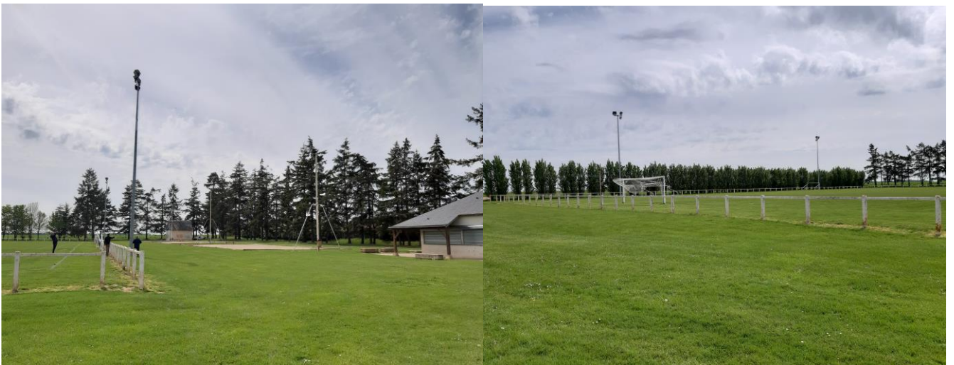
Terrain de football d'entraînement (sans éclairage actuellement)