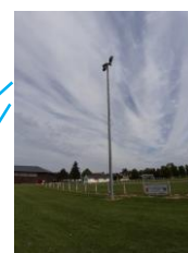
Eclairage actuel du terrain de football à changer en LED (offre de base)