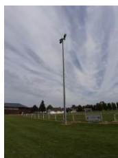
Eclairage actuel du terrain de football à changer en LED (offre de base)