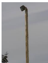
Eclairage actuel du terrain de pétanque à changer en LED (tranche optionnelle 1)

Le cercle bleu présente l'emplacement des terrains de pétanque, principal ou d'honneur de football et d'entraînement de football faisant l'objet du présent marché.