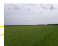
Terrain d'entraînement Emplacement des deux poteaux supplémentaires et de leur éclairage LED (tranche optionnelle 2)