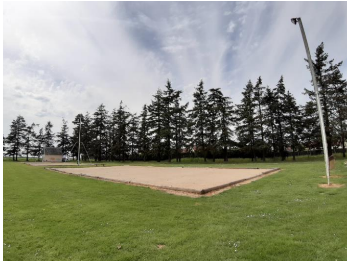
Eclairage actuel terrain de football principal